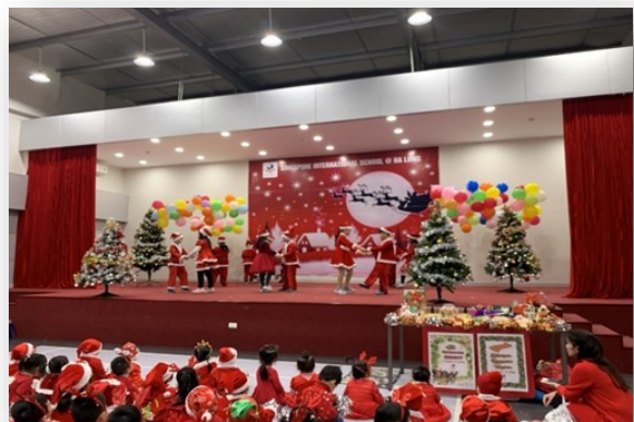
Ảnh trên: Chương trình văn nghệ trong Hội chợ Giáng sinh từ thiện. Ảnh dưới: Các em học sinh tạo dáng chụp ảnh tại Khu vườn STEM trong chuyến đi thăm Thiên đường hoa Quảng La