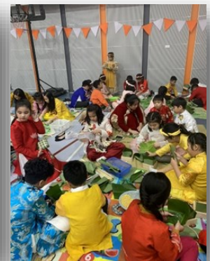
Các em học sinh làm bánh chưng trên phòng đa năng trong Chương trình mừng Tết theo sự hướng dẫn của các thầy cô giáo.