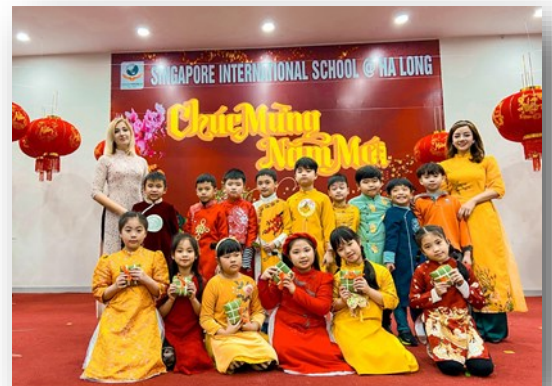
Ảnh trên: Các em học sinh diện trang phục truyền thống Áo dài và biểu diễn văn nghệ trong Chương trình mừng Tết.