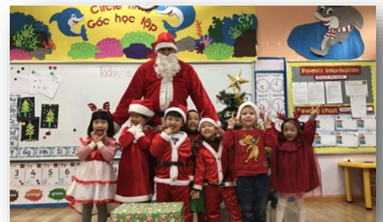
Ảnh dưới: Các em học sinh mặc trang phục ông già Noel trong Hội chợ Giáng sinh từ thiện. Ông già Noel cũng đã xuất hiện tại trường nhằm non để phát quà cho các em nhỏ đã rất ngoan ngoãn trong năm qua.