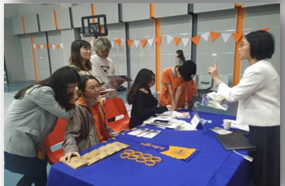
Ảnh trên: Phụ huynh và các em học sinh Lớp 8, 9 và 11 cùng tham dự buổi thảo luận về các trường đại học tại phòng đa năng. Các em đã có cơ hội đặt nhiều câu hỏi để tìm hiểu về các chương trình đại học.