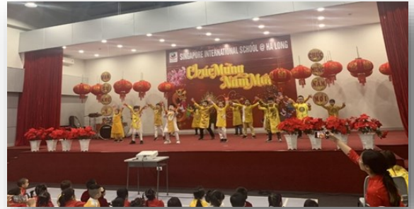
Các em học sinh Lớp 3 mặc áo dài biểu diễn trong chương trình mừng Tết