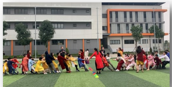
Các em học sinh tham gia kéo co trong Chương trình mừng Tết để chào đón năm mới.