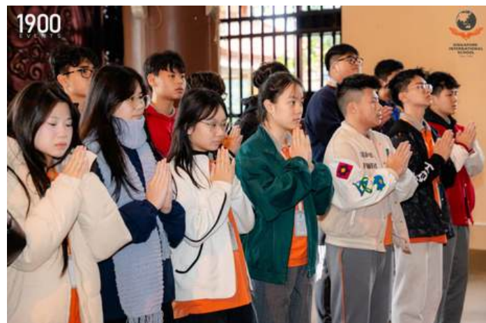
Học sinh trung học khám phá hòa bình, văn hóa và sự kết nối.