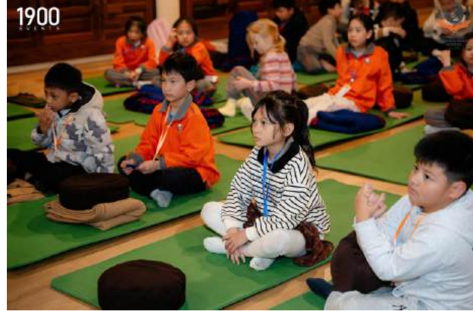
Học sinh trải nghiệm thiền định thư giãn - gieo mầm sự biết ơn