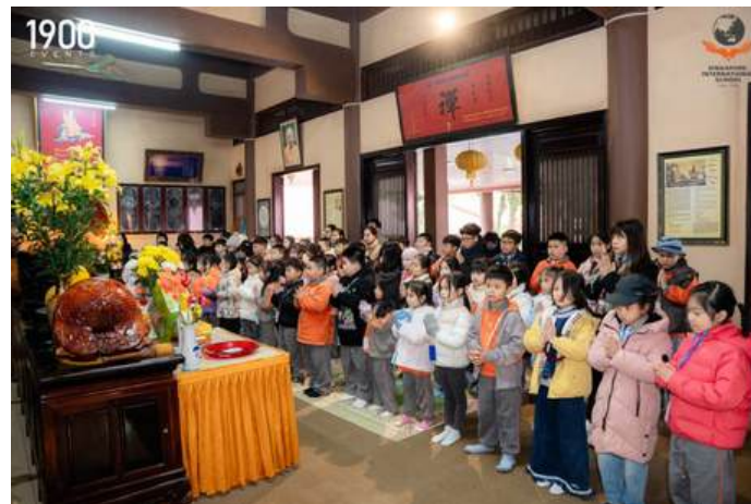
Các em học sinh tiểu học cùng nhau cầu nguyện - nơi việc học chạm đến tâm hồn.