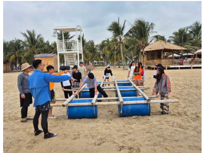
Các học sinh lớp 8 đang dựng bè trong chuyến OBV.