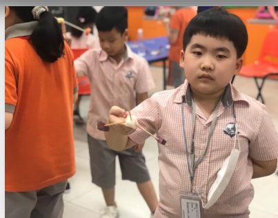
Ảnh trên và ảnh bên phải: Học sinh câu lạc bộ STEM đang làm “rau củ thăng bằng”, nó có thể chuyển động và tự cân bằng