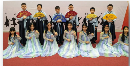
Ảnh trên: Học sinh lớp 5 biểu diễn một điệu nhảy Trung Quốc truyền thống, đoạn video tiết mục của các em đã được gửi đến các lớp để xem khi các em đang liên hoan Trung Thu tại lớp.