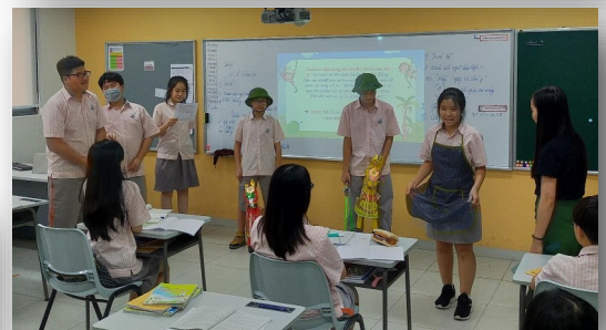
Ảnh trên: Học sinh lớp 8 đang đóng kịch trong một tiết học Ngữ Văn.