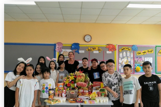
Ảnh trên: Học sinh ăn mừng Lễ hội Trung Thu tại lớp học. Các lễ hội đã giảm về quy mô để đảm bảo các biện pháp phòng ngừa Covid-19 được quy định của Bộ G&ĐT