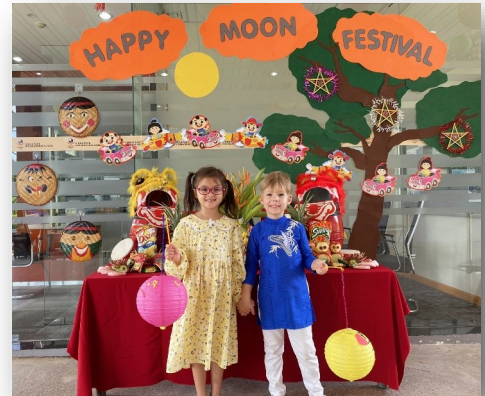
Ảnh trên và ảnh dưới: Vài em học sinh KIK trong trang phục truyền thống đang tạo dáng với đèn lồng tại khu vực trước cửa văn phòng.