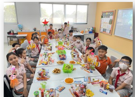
Ảnh dưới: Học sinh lớp 5 đang phá cỗ trung thu tại lớp học với, bánh trung thu và các loại đồ ăn vặt.