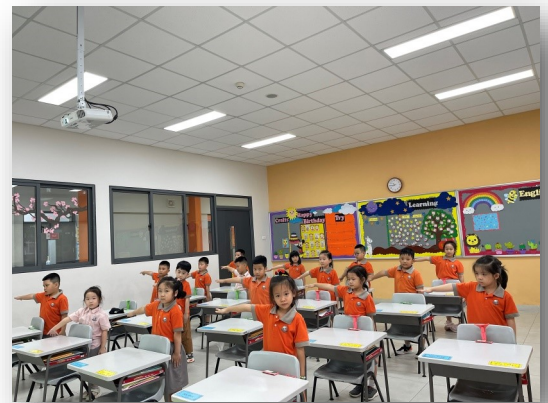
Ảnh trên: Học sinh đang đo giãn cách đủ tối thiểu 1m theo như quy tắc phòng chống dịch Covid-19