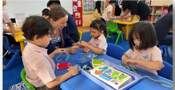
Các bố mẹ cùng tham gia vào những hoạt động giáo dục với các con trong Chương trình "Ở lại và vui chơi" diễn ra vào ngày 22/9/2023 tại trường.

Chúng tôi vô cùng hoan nghênh và xin chân thành cảm ơn những nỗ lực của các bậc phụ huynh trong việc cho con em mình đến trường trong bộ đồng phục trường. Khi trẻ mặc đồng phục, trẻ sẽ nhận ra rằng mình đến trường để học tập nghiêm túc chứ không chỉ để vui chơi. Cảm ơn cha mẹ một lần nữa vì điều này.