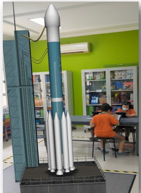
Một trong những hoạt động thú vị trong Tuần lễ Không gian.