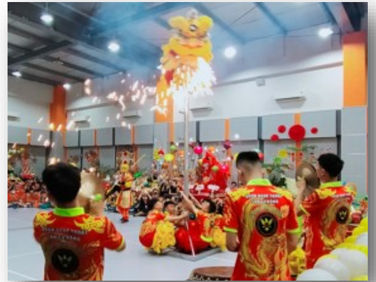
Màn múa lân hoành tráng với 3 chú sư tử đang phun lửa