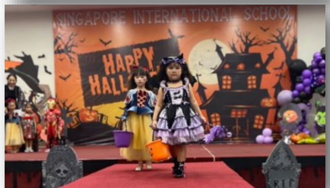
Học sinh Prep đang trình diễn trang phục ấn tượng tại Lễ hội Halloween của trường.