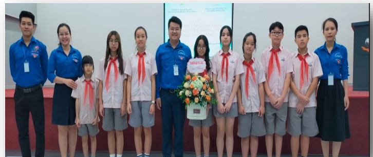
Các thành viên của Thành đoàn Hạ Long chụp ảnh kỷ niệm với các em học sinh.