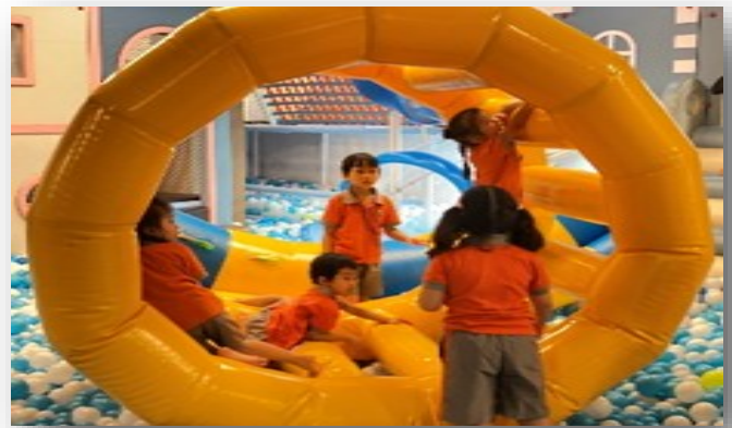
Các em học sinh mầm non đang chơi nhà bóng trong buổi trải nghiệm tại khu vui chơi Kid Fun vào ngày 14/09/2023.