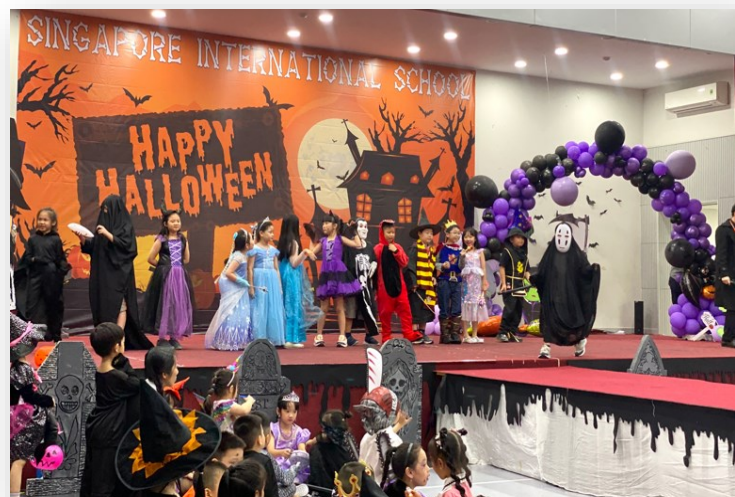
Nhiều em học sinh đã giành giải thưởng trong cuộc thi Vẽ tranh ma quỷ và Trang phục ấn tượng nhất tại Lễ hội Halloween của trường.